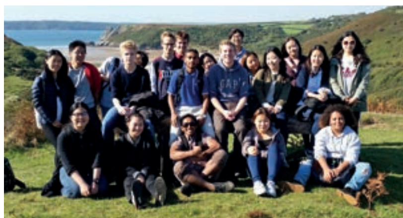
高尔半岛的三崖湾之旅