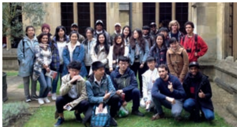
国际学生的牛津大学莫德林学院之旅