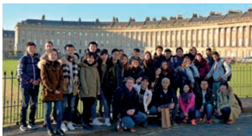
巴斯皇家新月之旅

参观的地区包括伦敦、巴斯、巨石阵、埃文河畔的斯特拉福德小镇（莎士比亚故乡）和温莎城堡等。文化体验活动使得国际学生有机会体验英国独特的文化与历史，丰富见闻，增长知识。